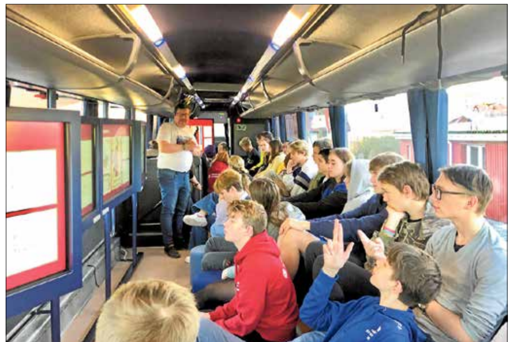
Genforeningsbussen kan rumme omkring 55 elever. Den er indrettet til undervisning og kan derfor ikke bruges som reel transportbus.